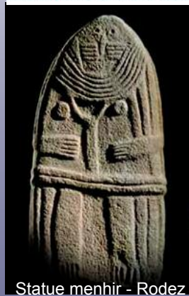
Statue menhir - Rodez

Mouvement pour une Alternative Non-violente