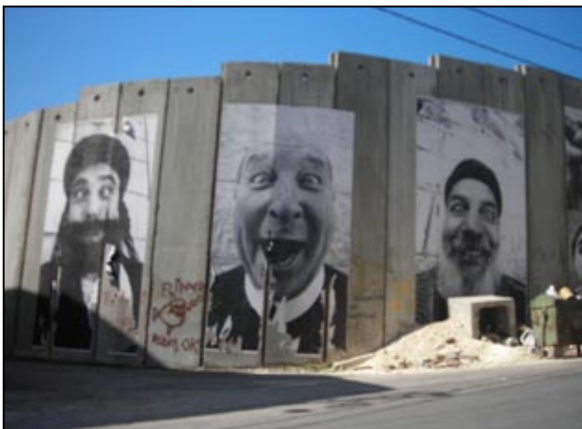
Le mur israélien à Bethléem

que quelques dizaines d'individus brisent les vitrines des magasins pour que tous les manifestants soient considérés comme des casseurs. Et cela viendra justifier la répression policière qui sera légitimée par les pouvoirs publics sous prétexte qu'il est nécessaire de "rétablir l'ordre".