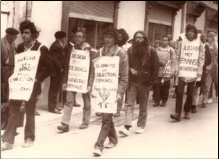
Objecteurs espagnols 1971

Il s'agit de s'abstenir de toute nourriture pendant quelques jours, disons entre 3 et 20 jours, afin d'interpeller à la fois les responsables de l'injustice et l'opinion publique. Une grève de la faim ne peut pas être une "grève de la soif". Il est au contraire important de boire de l'eau. Mais si les grévistes boivent du jus de fruit ou du thé sucré, il ne s'agit plus, à proprement parler, d'une grève de