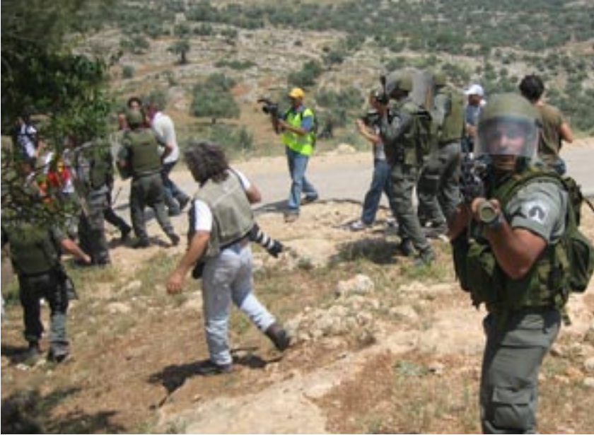
Soldats israéliens face aux manifestations non-violentes contre le mur à Bil'in

La répression fait partie intégrante d'une campagne d'action non-violente. Elle vient s'inscrire dans la logique de son développement naturel. Non seulement, il faut compter avec la répression mais il faut compter sur la répression. Pour autant que faire se peut, il faut «jouer avec la répression» en retournant toute son efficacité contre ceux qui la mettent en œuvre. Pour cela, il faut tout faire pour rester maître du jeu. Il importe d'estimer le plus