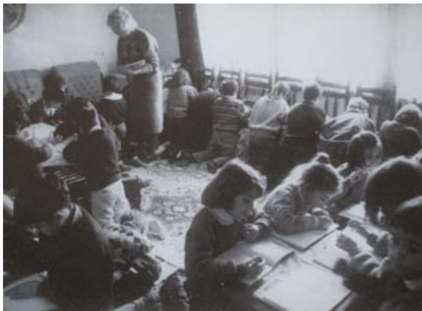
Classe parallèle - Kosovo 1993

Le programme constructif consiste à organiser parallèlement aux institutions et aux structures que l'on conteste et avec lesquelles on refuse de collaborer, des institutions et des structures qui permettent d'apporter une solution constructive aux problèmes posés. La réalisation du programme constructif doit permettre, à ceux qui ont été maintenus dans la situation de ne pas assurer leurs responsabilités à l'intérieur des structures économiques et politiques, de prendre en charge leur propre destin et de participer directement à la gestion des affaires qui les concernent. Il