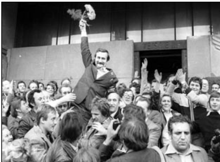
Lech Walesas, leader de Solidarnosc en Pologne

GANDHI, Tous les hommes sont frères , Gallimard, 1969, p. 161.