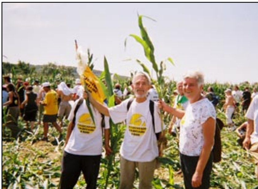
Faucheurs volontaires contre les OGM

quelque sorte approuver et voter le budget de l'État. Pour que l'action puisse se populariser, on aura intérêt à organiser un refus partiel qui ne corresponde pas forcément à la réalité des sommes concernées dans le budget de l'État. Mais revendiquer et exercer son pouvoir de contribuable ne doit pas seulement consister à refuser l'impôt, il s'agit aussi de le redistribuer en l'affectant à des réalisations qui contribuent à construire la justice.