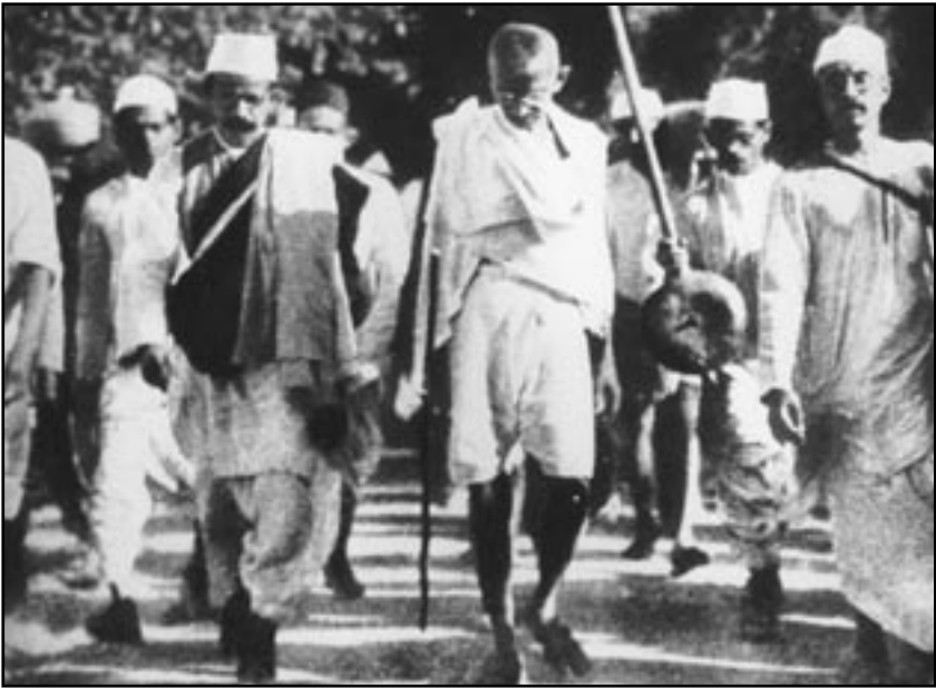
Gandhi lors de la marche du sel en 1930

Paul RICCEUR, Histoire et Vérité , Seuil, 1955, p. 224.