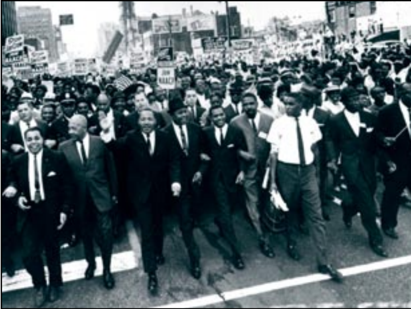
Martin Luther King à Détroit, 23 juin 1964

ler, de la conscientiser et de la mobiliser afin qu'elle prenne fait et cause en faveur des résistants. Le but recherché est qu'elle exerce une pression sur les décideurs afin qu'ils reconnaissent les droits des résistants. Pour leur part, les décideurs tenteront également de mettre l'opinion publique de leur côté. Ceux qui gagneront "la bataille de l'opinion publique" auront toutes les chances de créer un rapport de force en leur faveur.