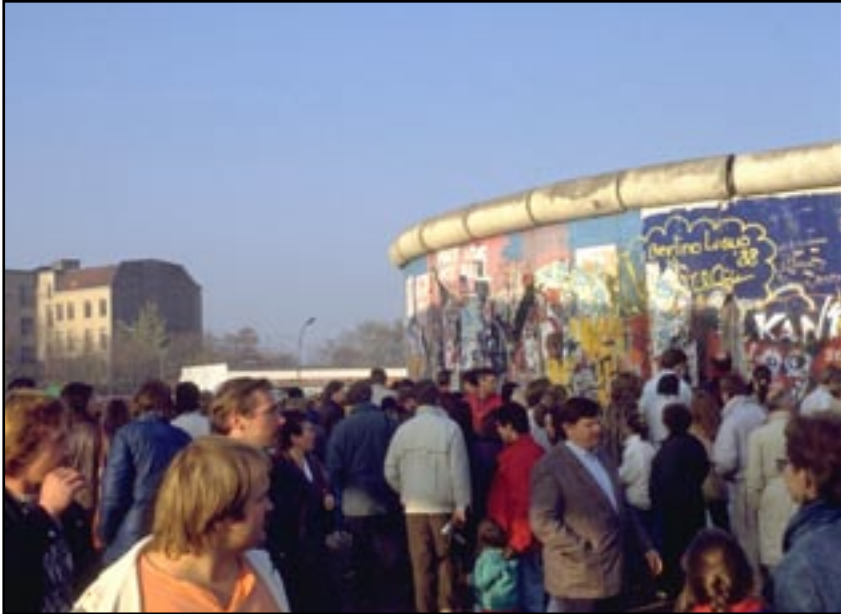
La chute du mur de Berlin 1989.

Étienne de la BOÉTIE, Le discours de la servitude volontaire , Payot, 1985, p. 183.